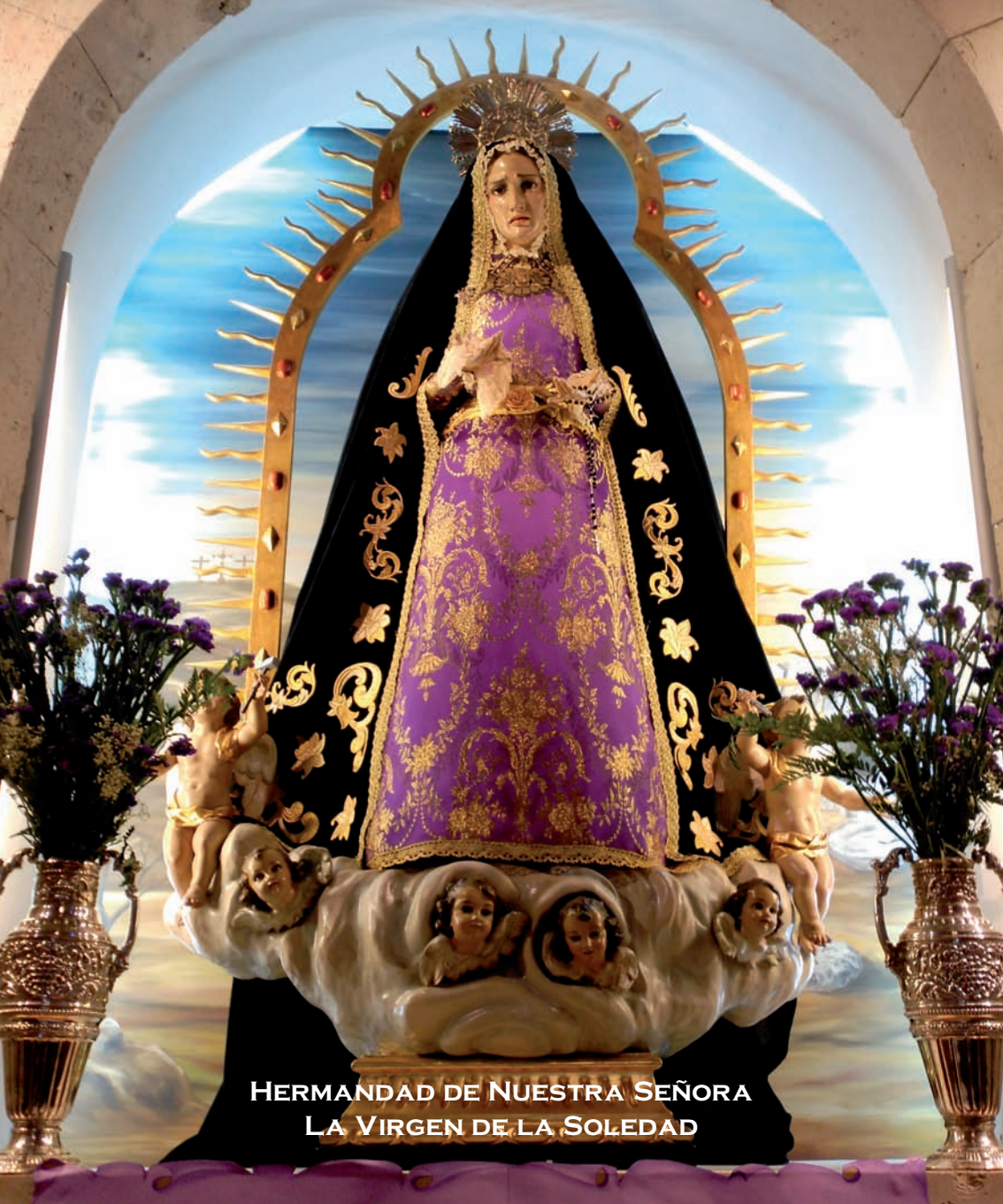
HERMANDAD DE NUESTRA SEÑORA LA VIRGEN DE LA SOLEDAD