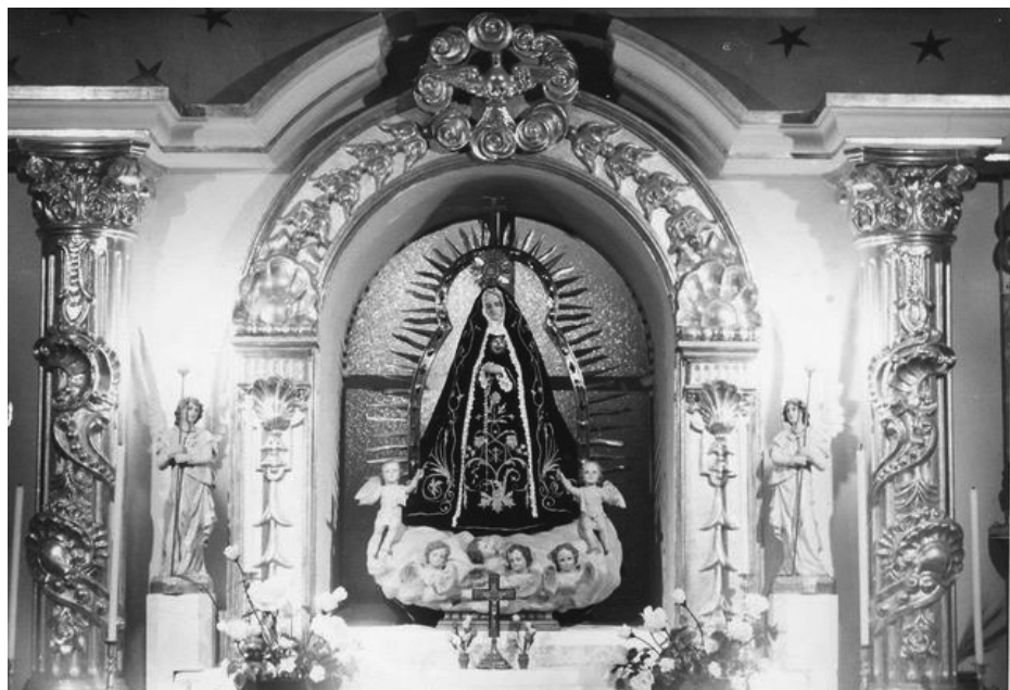
Virgen de la Soledad en México